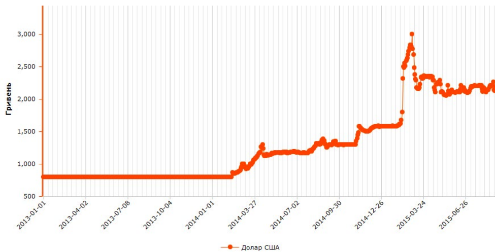
Рис.2. Динаміка зміни офіційного курсу гривні до долара США 01.01.2013-01.09.2015 р.