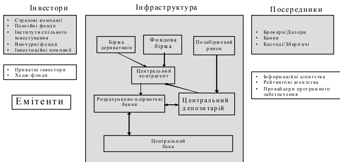
Рис.1. Місце центрального депозитарію на ринку цінних паперів та інших фінансових інструментів.